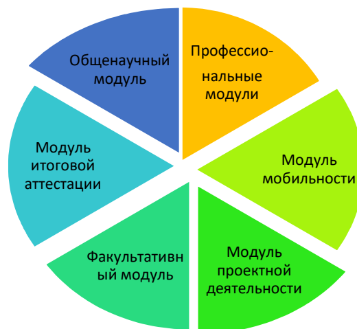
Рисунок 4. Структура образовательной модели программы магистратуры

- Общенаучный модуль для всех направлений, в рамках которого происходит освоение универсальных и общепрофессиональных компетенций.